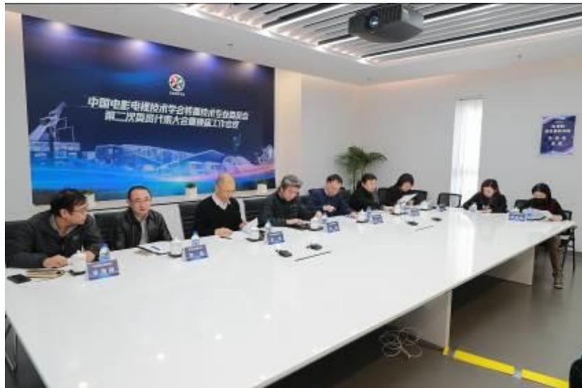
第二次委员代表大会暨换届工作会议主会场

按照第九届中国电影电视技术学会理事会整体工作部署，转播技术专业委员会第二次委员代表大会暨换届工作会议于 2021 年 11 月 19 日顺利召开。为执行北京地区对防疫工作的要求，本次会议采用线上视频会议形式召开，并设置线下主会场，主会场设于“央视网人工智能编辑部”会议室。京外所有专委会副主任、专委会委员单位及个人专家委员等 127 人出席。